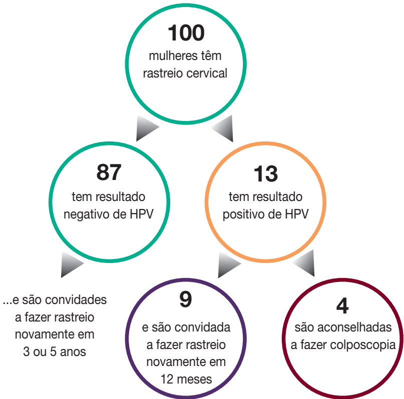
Diagrama mostrando os resultados de cada 100 pessoas que fizeram exame cervical